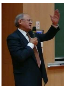
Merci à tous !

Aux administrateurs qui ont souhaité se démettre de leur fonction ou ne pas la renouveler vont les remerciements de l'UTL, pour l'énergie, le temps, la réflexion et l'enthousiasme prodigués au service de notre association :